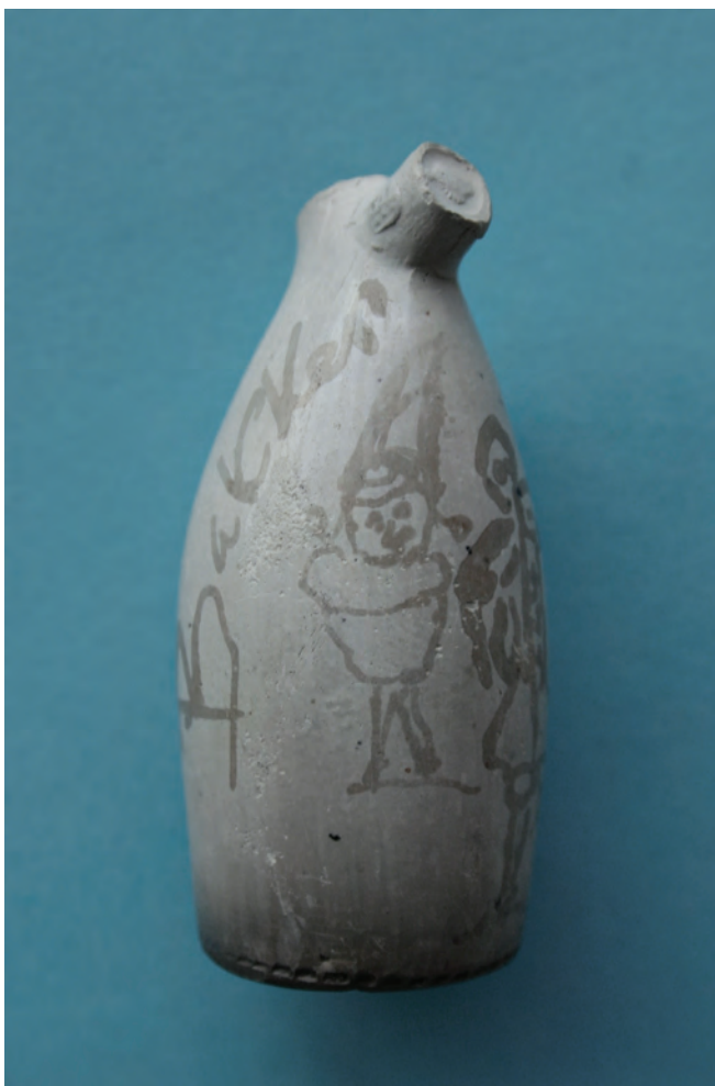
Afb. 3 a,b, c. Kegelvormig figuurtje en twee pijprokers.

De pijp bevindt zich in een Privé collectie.