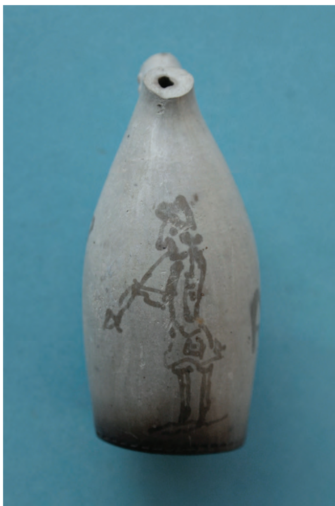
Afb. 3 c.