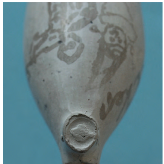
Afb. 2. Het gestempelde hielmerk both, Gouda 1750-1800.