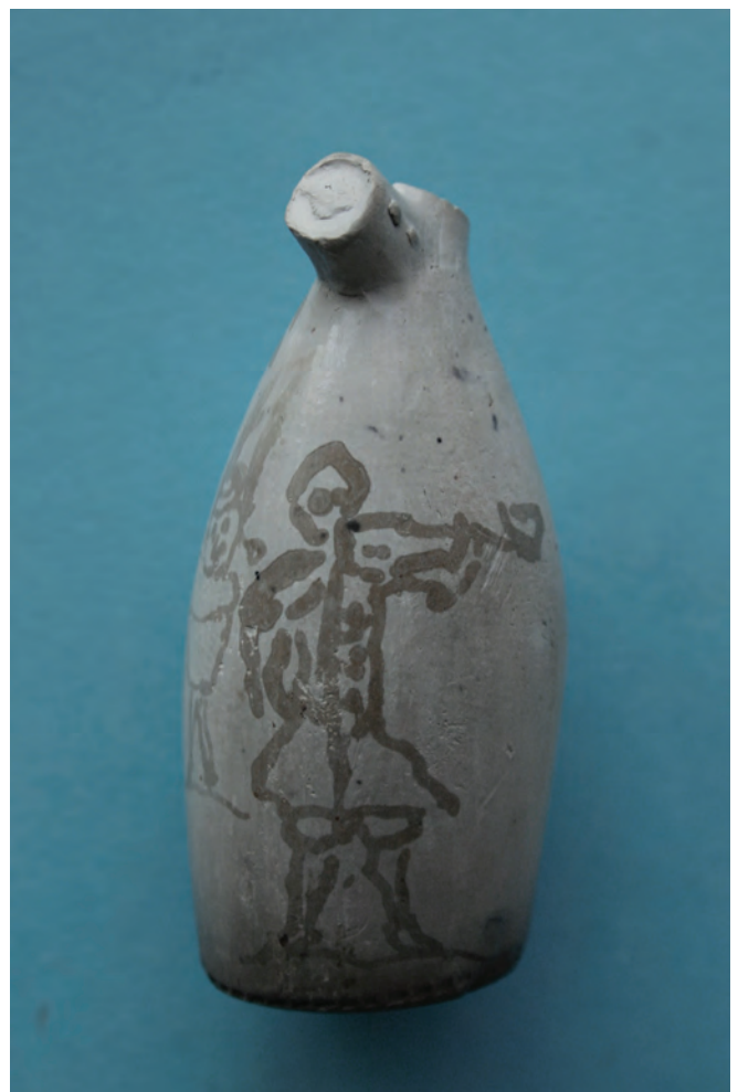
Afb. 3 b.